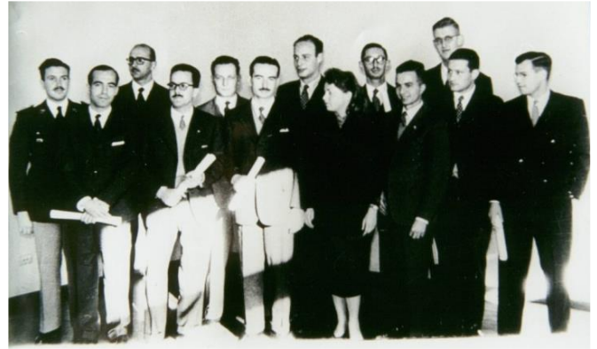
7 de junio de 1958: 1ra promoción de Licenciados en Física del Instituto Balseiro.

https://www.ib.edu.ar/comunicacion-y-prensa/noticias/item/1776-el-balseiro-anuncio-a-los-och-finalistas-de-la-10ma-edicion-del-concurso-ib50k.html